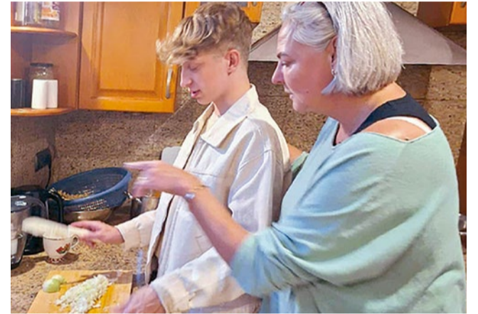
Dom dla Młodzieży Fundacji Po Drugie

Każdego miesiąca przekazujemy ok. 20 ton pieczywa osobom i instytucjom w potrzebie. Niesprzedane wypieki z ponad stu piekarni trafiają do licznych organizacji, hospicjów, DPS-ów i schronisk. To dla nas naturalna część pracy i odpowiedzialności za ograniczanie marnowania żywności. Każdy gest i każda inicjatywa to krok w stronę lepszego świata. Nie możemy pomóc wszystkim, ale możemy zmieniać życie konkretnych osób. I to właśnie nadaje sens naszej codziennej pracy.